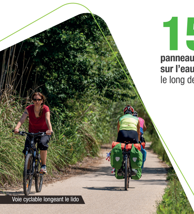
Voie cyclable longeant le lido